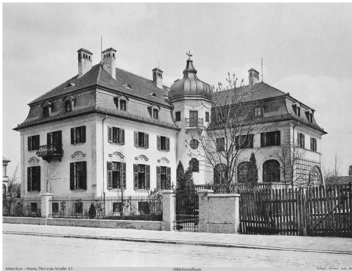
La Hildebrandhaus en 1903