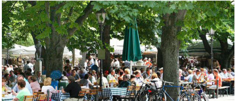
Le Biergarten du Viktualienmarkt

Notre visite ne peut pas échapper aux lieux qui sont ceux du Oktoberfest , fête de la bière mondialement renommée. On constate très vite que les Munichois n'attendent pas le mois d'octobre pour consommer du houblon ! Au Viktualienmarkt et à la Hofbräuhaus , la bière semble couler à flot en permanence, ce dont nous ne nous plaindrons pas pour le reste du séjour ! Eclectique, superbe, fière d'elle-même jusqu'à l'agacement, mais incontestablement charmante et enjouée, Munich reste une ville très attirante, dans laquelle, comme on dit en France, il y a à boire et à manger... Et en abondance !