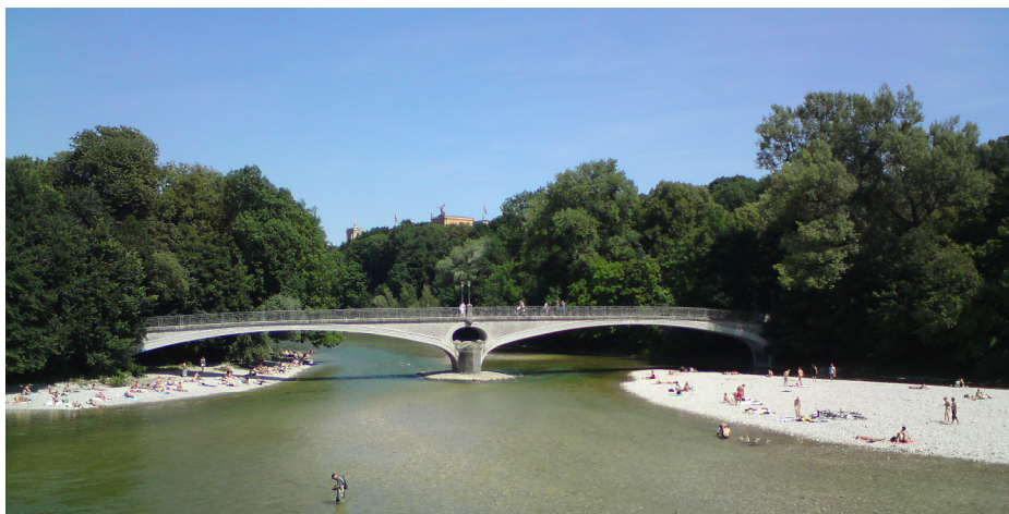
Pont sur L'Isar