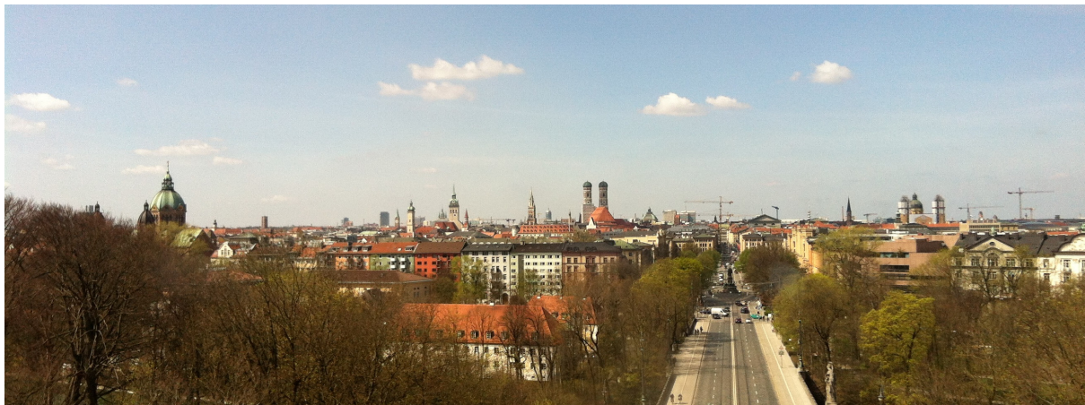
Panorama de la ville vue par la terrasse du Maximilianeum