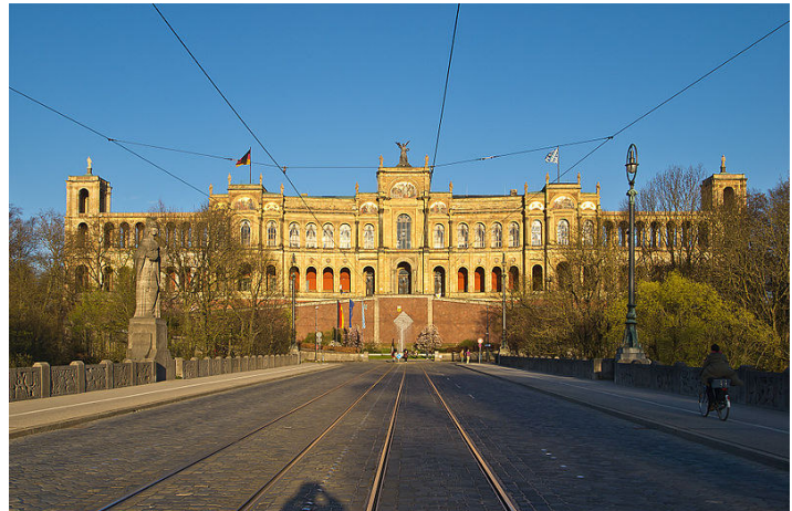
Le Maximilianeum en 2012

Maximilien avait déjà conçu le projet de créer une institution destinée à assister les jeunes étudiants quand il était prince-héritier. Accédant au trône en 1848, il entreprit la réalisation de son projet ambitieux. Comme le Parlement lui a refusé obstinément les moyens financiers nécessaires, Maximilien a utilisé ses fonds personnels pour ouvrir l' Athenaeum en 1852, qui a été rebaptisé Maximilianeum Royal cinq ans plus tard. L'épithète « Royal » a disparu dans la foulée de la Révolution républicaine de novembre 1918. À partir de ce moment, l'institution porte son nom actuel.