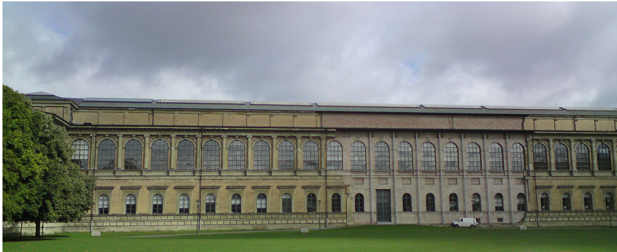
La façade nord de la Alte Pinakothek